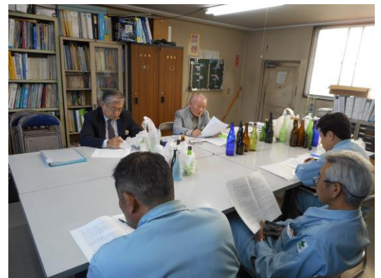
診断報告会様子写真（酒瓶を目の前に議論する）